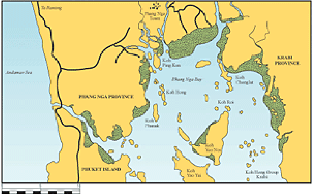
NORTH PHANG NGA BAY

La Baia di Phang-Nga sicuramente uno degli ambienti naturali più belli in assoluto nei dintorni dell'isola di Phuket.