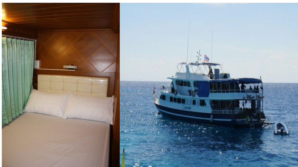
Nave per Crociera Snorkeling & interno cabine.